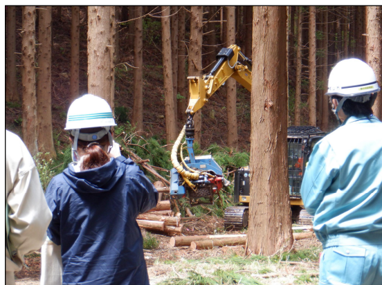
▲現地視察の様子(令和5年度)