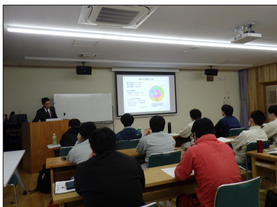
▲座学の様子(令和6年度)

※本講座は現地参集による座学と現地見学により行いますが、座学部分はオンライン(Zoom)で補助的に聴講することも可能です。オンライン聴講を希望する方も、受講申込書に必要事項を記載してお申し込みください。