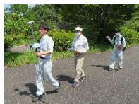
フィールド調査の様子

国の研究機関と連携・協力して、県民の安全安心につながるよう、環境回復・創造に関する調査研究を推進します。