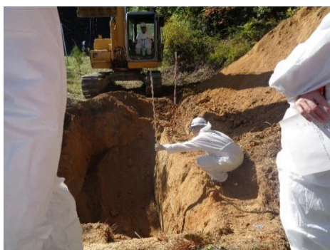
【重機による くっさく 掘削作業】

こうびょうげんせいとり 高病原性鳥インフルエンザは、2004年に国内で確認されて以降、渡り鳥が日本へ渡る秋から帰路につく春までの間に全国で発生が確認されています。このため、 こうびょうげんせいとり 高病原性鳥インフルエンザが発生した際、迅速かつ的確な感染拡大防止ができるよう、10月24日（金）に実際に重機を用いた埋却 まいきやく 演習、12月3日（水）に三春合同庁舎を会場として机上演習を開催しました。埋却演習には、県建設業協会等の関係機関において現場で実際に作業に従事する職員25名、机上演習には39名が参加し、一連の流れを実際に体験し有事の際の防疫対策を確認しました。今回の演習をふまえ、緊急時に迅速に防疫対策を講じられるよう体制を強化してまいります。