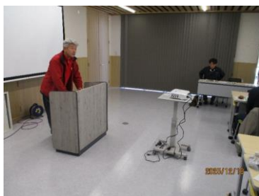
【篤農家による講演「栽培で苦勞したこと」】

須賀川農業普及所では栽培経験が浅い生産者を対象に「きゅうり基礎力アップ研修会」を開催しています。12月18日（木）には第6回研修会として反省検討会を開催しました。県中農林事務所職員やJAきゅうりん館担当者による今年度の反省や次年度対策、種苗メーカー担当者による りょくひ 緑肥の紹介、 とくのうか 篤農家（※）も交えたグループワーク等を行いました。参加者からは「グループワークで各生産者と話す機会があると、悩みや課題が共有できるので勉強になった」等多数の好評の声がありました。次年度以降も引き続き、露地きゅうり栽培の早期技術習得に向けて関係機関一丸となって支援していきます！