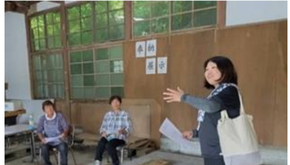
【さやいんげん指導会の様子】

きゅうり・いちご・ネギを中心に野菜を担当しています。職務経験者採用ということですが、生産者に寄り添っていく普及員を目指して、日々現場での技術と知識を積み上げていきたいと思えます。