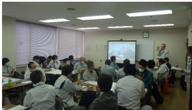
【点検後の検討会の様子】