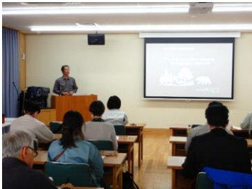
【大槻氏による講義】

県中農林事務所からは、里山林整備にかかる各種補助事業について説明しました。参加者からは、「集落では電気柵によるイノシシ対策が主だったが、周辺の里山林整備も含めた一体的な鳥獣被害防止対策について検討していきたい」などの感想がありました。