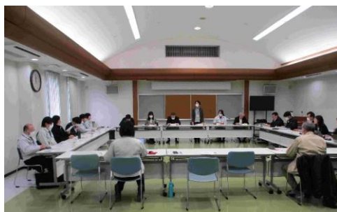
【ワーキンググループの様子】

1月22日（木）、JA 夢みなみきゅうりん館で「第2回 いわせ 岩瀬きゅうりならではプランワーキンググループ」を開催しました。生産者代表、JA、全農、市町村、県等21名が参集し、岩瀬きゅうりの生産振興について今年度実績や次年度の計画及び役割分担について検討しました。今年度は「岩瀬きゅうり」を標記した小袋を作成し、マックスバリュ あたみ ー熱海店（静岡県）等でテストマーケティングを行う等新たな取り組みを行いました。次年度も引き続き産地の生産安定に向けて関係機関が連携して、産地の生産振興を図ってまいります。