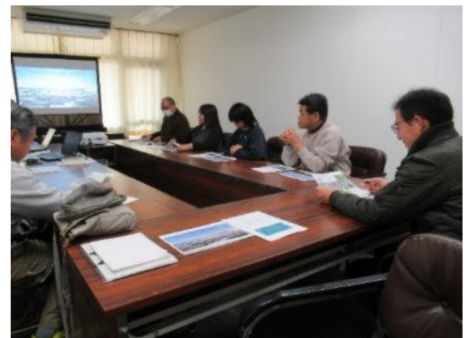
【常総市役所の説明を受ける様子】