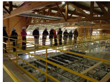
【木材生産協同組合の見学の様子】