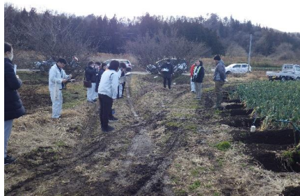
【長ネギほ場の見学の様子】

1月16日（金）および1月21日（水）に管内の現状と課題、各部所の業務に関する認識を深め、連携して課題の解決にあたるため、若手職員を中心に現地研修会を開催しました。1回目の1月16日には「有限会社アグリサービスあさか野」、「天栄長ネギ生産組合」にて、共同で農作業を行い併せて地域の農地を守る取り組みを行っている農業者方々のお話を伺い、現地見学などを行うとともに、天栄村の活性化に取り組んでいる「一般社団法人天栄村ふるさと夢学校」「道の駅 きさと 郷天栄」の見学などを行いました。2回目の1月21日には同じ事務所内でも直接事業に関わらないとなかなか知ることのできない「阿武隈川上流遊水池群整備計画地区」「福島県郡山地区木材生産協同組合」「農村地域防災減災事業（琵琶沢池地区） びわさわいけ 」の見学を行いました。各所で担当者から説明を聴き、各部所で行っている業務に対して互いに理解を深めることができました。