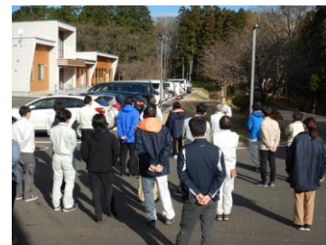
【クマとの距離の体験会】