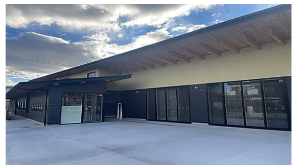
【須賀川農業普及所外観】