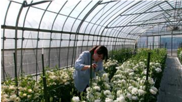
【トルコギキョウの生育調査の様子】

郡山市の花きの普及業務をしています。分からないことが多く、上司や先輩方に相談してばかりの毎日ですが、少しずつ自分にできることを増やし、郡山市の花きの振興に貢献できるよう、尽力していきます。