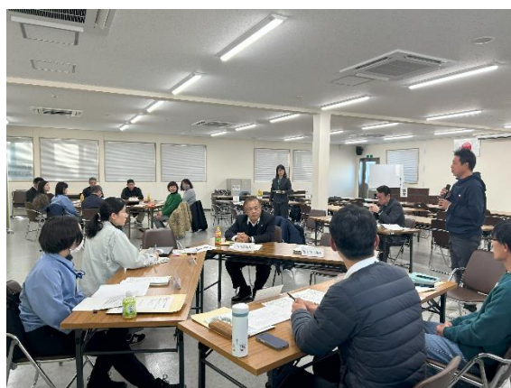
【第4回農業塾ワークショップの様子】