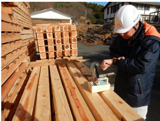
【製材品の表面線量測定】

URL: https://www.pref.fukushima.lg.jp/site/portal/ps-kensanzaityousa.html