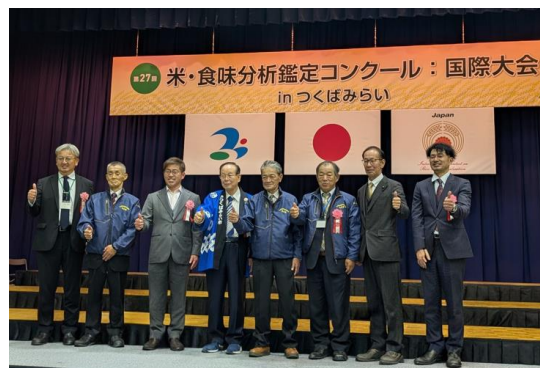
【金賞を受賞されたみなさん】

12月6日（土）、7日（日）に茨城県で開催された「第27回米・食味分析鑑定コンクール国際大会 in つくばみらい」に、天栄村の天栄米栽培研究会からも出品され、見事3名が金賞に輝きました！受賞された方々は、喜びに浸りながらも、すでに今年開催の第28回須賀川 いわせ 岩瀬大会に向け、「さらにおいしいお米作りに励みたい」と意気込みを語ってくれました。