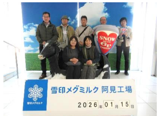
【雪印メグミルク(株)阿見工場 あみ 視察】

参加した農業士の方々は、視察先の説明に対して質問や情報共有を積極的に行っており、自身の経営品目と異なる農業の取組に知見を深められた様子でした。