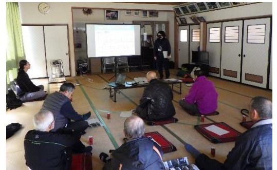
【実績検討会の様子】

一方で、除草作業の遅れにより、一部ほ場で電圧の低下やイノシシの侵入がみられたことから、次年度は電気柵の点検、適期の除草を課題として活動を行う計画です。