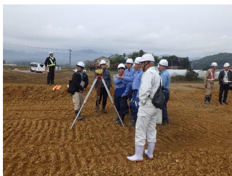
【県営ほ場整備工事現場を体験する様子】

三穂田北部地区では、工事を施工する建設会社の協力により、実際に工事で使用する測量器具やドローンを操作体験でき、生徒たちは興味津々でした。「農業に関わる工事現場の作業を実際に体験できて、とても貴重な機会となった。」と土地改良事業への理解を深めたようでした。