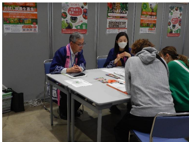
【県中農林事務所ブースでの相談の様子】

「ふくしま農業人フェア」は、多様な農業の担い手を確保するために県が開催している県内最大級の就農相談会です。令和7年度は会津若松市、福島市、郡山市、いわき市の4か所で開催しました。郡山市では11月24日（月・祝）にビッグパレットふくしまで実施し、雇用を希望する農業者や法人、市町村、研修機関等がブースを構えました。当日は就農希望者や農業に興味のある方141名が来場し、各ブースで熱心に相談されていました。また農業機械の展示やキュウリ栽培のVR体験コーナーもあり、とても賑わったイベントとなりました。