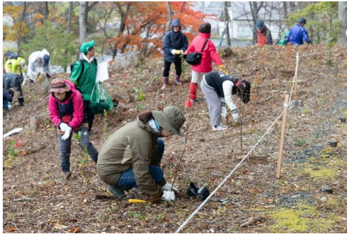
【一般参加者による植樹の様子】

町内外から約300名が参加し、ヤエザクラやイロハモミジなどの苗木を植樹しました。苗木がこれから大きくなり、多くの方が森林や木との触れ合いを楽しむことを期待します。