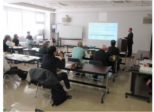
【講座3「法人化の基礎と実践」の様子】

就農研修生、新規就農者、認定農業者、集落営農組合の代表者等計36名が参加され、パソコン農業簿記の開始や集落営農組織の法人化を進めていく等、今後の経営の向上と発展が期待されます。地域を代表する法人から事例を紹介いただき、出席者は刺激を受けていました。