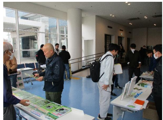
【ロビーでの資料展示の様子】