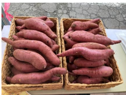
【配布した田村市産「栗かぐや」】

県中農林事務所では引き続き、県産農林水産物の消費拡大及び地産地消を推進していきます。