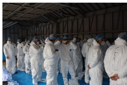
【隣接テントで防護服の着衣】