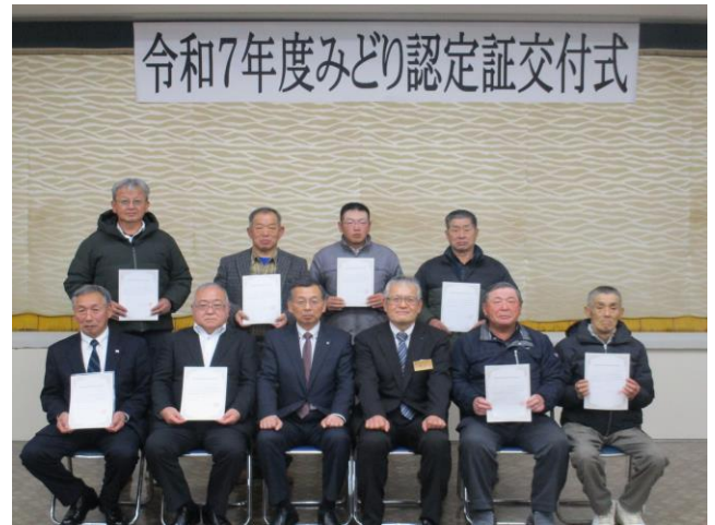
【令和7年12月の認定証交付式の様子】

認定を受けると環境に配慮した営農に必要な設備投資への税制優遇や国庫補助事業の優先採択等のメリットがあります。また、令和9年度以降は、環境保全型農業直接支払交付金の受給要件となる予定です。認定を受けるためには、環境負荷低減に取り組む事業計画を作成する必要があります。認定を希望する場合は普及所までご相談ください。