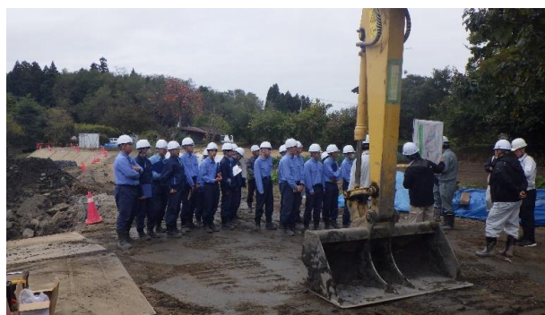
【ため池工事の説明を受ける様子】