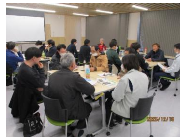
【グループワークの様子】

※ とくのうか 篤農家とは、農業に非常に熱心で、研究熱心、先進的な技術を取り入れ、地域や農業全体の発展に貢献する模範的な農家を指します。