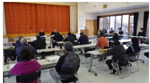
【権利者会議の様子】

今後も複数地区にて権利者会議を予定していますので、引き続きほ場整備事業の推進に権利者の皆さんと一丸となって取り組んでまいります。