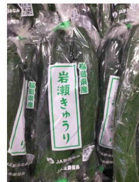
【試作した「岩瀬きゅうり」を標記した小袋】