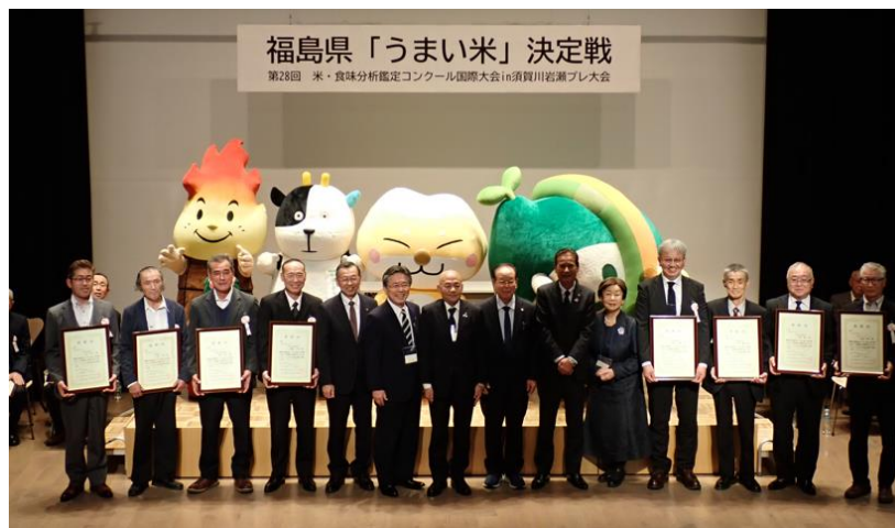
【金賞を受賞されたみなさん】

この「うまい米」決定戦は令和8年から3年連続福島県内で開催される「お米のおいしさ」を競う国内最大のコンクールのプレ大会です。今回は福島県内から279検体の出品があり、須賀川市1点、鏡石町2点、天栄村4点が金賞に選ばれました。大会では、トークショーや農産品などの販売コーナーが設けられ、今年12月の須賀川市開催に向けて大いに盛り上がりました。