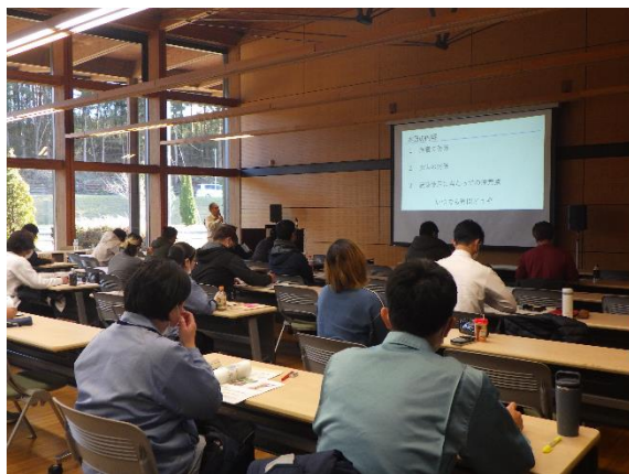
【第3回農業塾の様子】

参加した新規就農者等は熱心に受講し、積極的に質問していました。また、受講後のアンケートでは、良く理解できた、また参加したい等の意見を多くいただきました。農業振興普及部では、今後も、新規就農者等の生産や経営面の知識・技術の習得や、相互の人脈作り促進を目的に、「郡山農業塾」を開催してまいります。