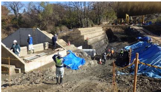
【現場パトロール状況（川屋池地区）】

点検後の検討会では、参加者全員で良好点と改善点について確認し合い、今後の安全管理に活かすとともに、年度末に向けて労働災害防止に一層努めていくこととしました。