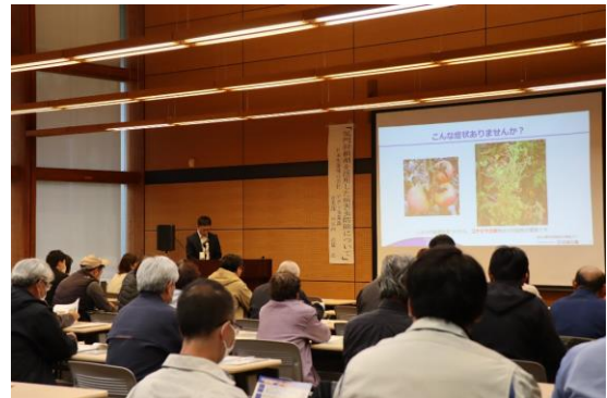
【県中地方園芸振興セミナーの様子】

園芸品目では、近年春先からの気温上昇により、特に害虫の被害が増えています。来作へ向けた効果的な害虫対策のポイントについて、参加者は熱心に聴講していました。農業振興普及部では今後とも、産地の課題解決に資する情報提供を通じて、県中地方の園芸振興を図ってまいります。