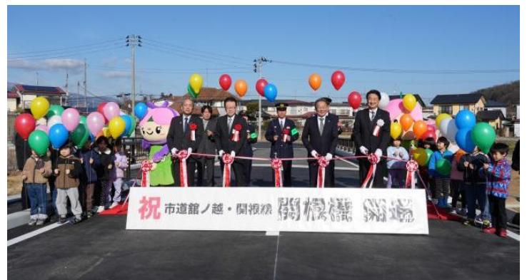
関根橋（市道館ノ越・関根線）の開通式

今後も百日川の河川工事を継続して実施するため、皆様には不便をおかけすることありますが、洪水被害の軽減を図る工事に、ご理解とご協力をお願いいたします。