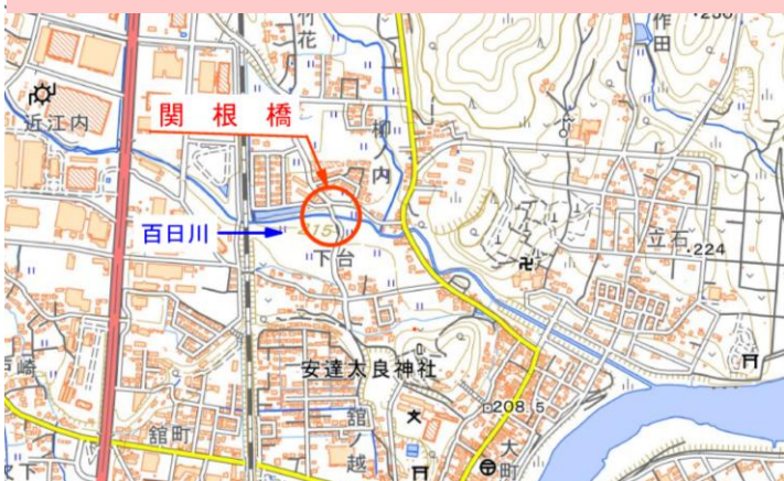
百日川 関根橋 位置図