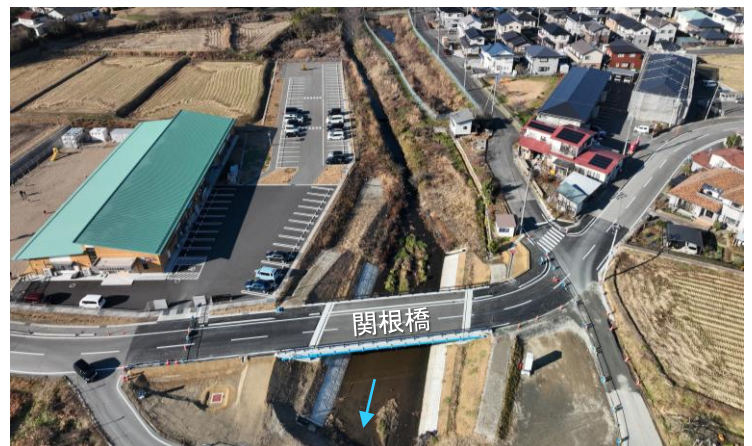
整備が進む百日川筋