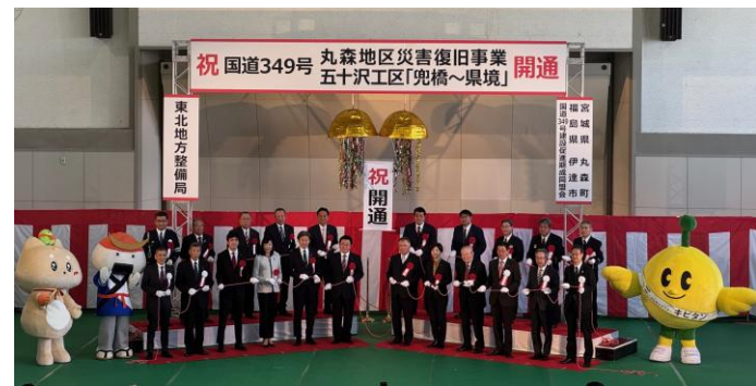
3月22日開催された開通報告会

引き続き、 県北建設事務所では、 兜橋から安禅寺付近 までの区間を、 五十沢2工区とし、 調査設計を 進めてまいります。