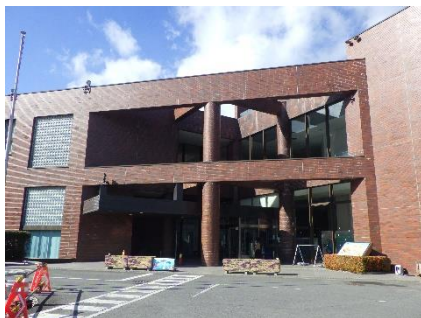
女川原子力PRセンターの様子①